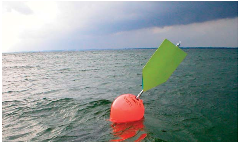
Die Bojen können die Geschwindigkeit und die Richtung der Strömung anzeigen.